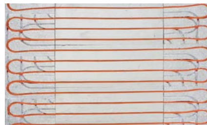
Multiklemm-Systemplatte für Trockenestrich