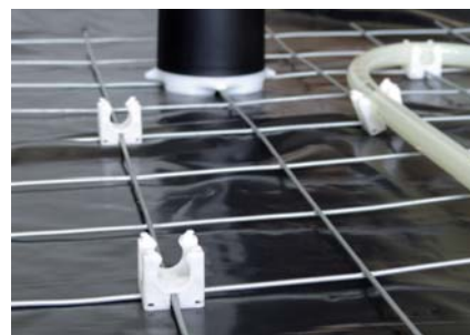
Stahldraht-Gittermatte System SMCP Smartclip

Die einwandfreie Funktion über Jahrzehnte wird unterstützt durch die Verwendung der weiteren Pipelife Floortherm-Systemkomponenten: