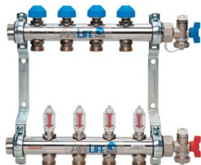
Verteiler aus Edelstahl