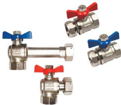
Eckkugelhahn, gerader Kugelhahn für die Verteileranbindung